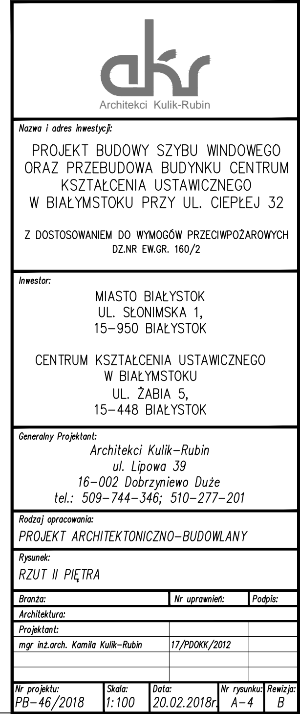
RZUT II PIĘTRA